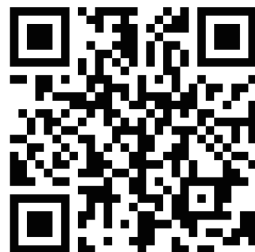
新規登録 QR コード