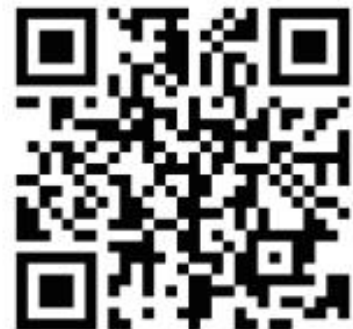
新規登録 QR コード

ログイン後、登録したお写真が画面右上に表示されます。クリックするとデジタル会員証が開きます。編集もそこから可能となります。